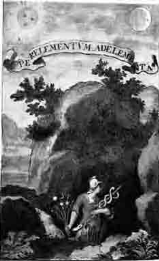
‘Door het element naar de elementen’: Hermes, getooid met in de ene hand de caduceus (de slangenstaf) en in de andere hand de zeven planeten, daalt af in de onderwereld, om het Lichtelement te bevrijden. Uit: Baro Urbigerus Besondere chymische Schrifften, 1705

Aldus stuurt hij het aardse leven. Hij wordt gelijkgesteld aan het zilverwater, omdat de zon overeenkomt met het vurige goud. In de mystiek wijst de maan als de geliefde van de zon er steeds weer op dat de ziel van de mens een zuivere spiegel voor de geest kan zijn, zodat de vereniging kan plaatsvinden.