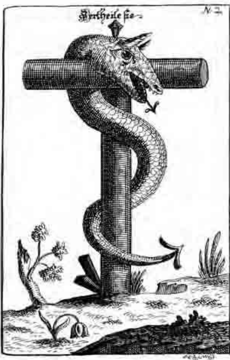
Gekruisigde slang, mercurius bedwongen (zie pagina 37). Op de voorgrond verwelkt een bloem, terwijl aan de jonge boom nieuwe loten ontspringen Uit: Abraham Eleazar (pseudo.) Uraltes chymisches Werck, 1735